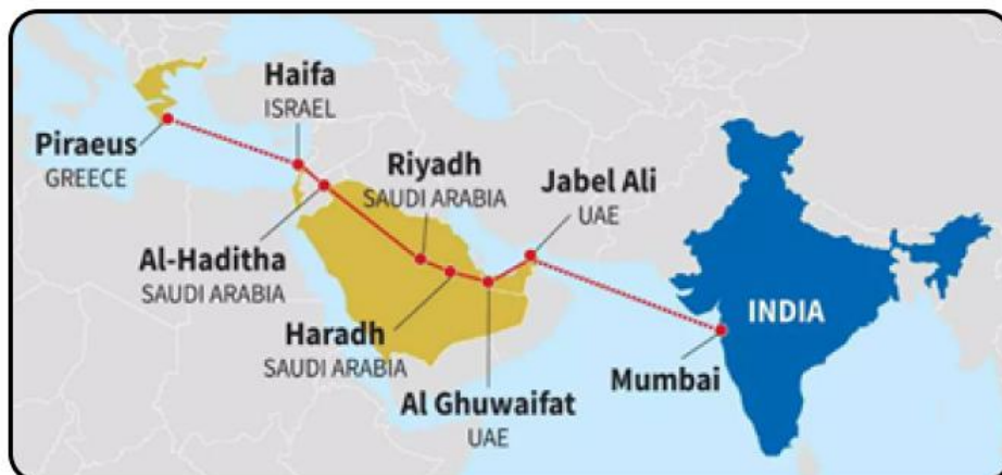
IMEC ROUTE MAP